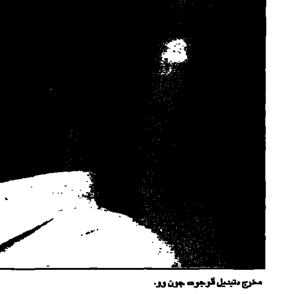
مخترع تصميم الجوزة جون وو.

وهو للتخصص في تطعيم الزواج وكثرة الجثث والتفكرات السوفيتية التي تمس الاذان. انه يارح ايضا في اخراج المشاهير الهائلة، وخاصة للثقافات الغربية من الاطفال.